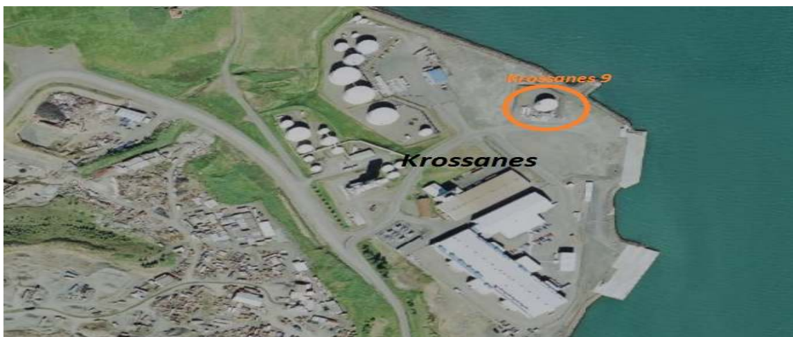
Mynd 1. Staðsetning

3.Staðsetning: Nesbik ehf er staðsett að Krossanesi 9, Akureyri, á svæði Krossanes.