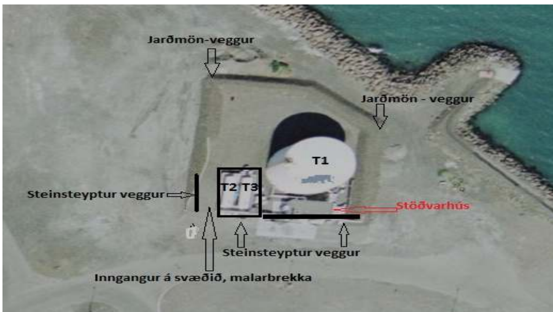
Mynd 3. Staðhættir

1. Lóð og mannvirki: Stærð lóðar er 3167,4 m 2 . Stöðvarhús er á einni hæð og er 70m 2 . Einn geymslutankur er fyrir stungubik(T1) og tveir lárfóliu(T2 og T3). Steinsteyptur veggur er að hluta kringum lóðina en annars er jarðmön umhverfis lóðina, 1,5m að hæð. Steypt þró er í kringum lífólíutankana T2 og T3, 1,5m að hæð. Inngangur á svæðið er yfir 1.5m háa hækkun ( yfir malarbrekku. Svæðið er þannig allt ein stór lekaþró fyrir stungubikið.